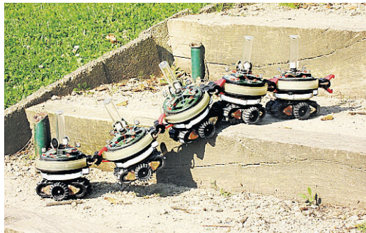
Små robotar kopplar ihop sig för att ta sig upp för en trappa.