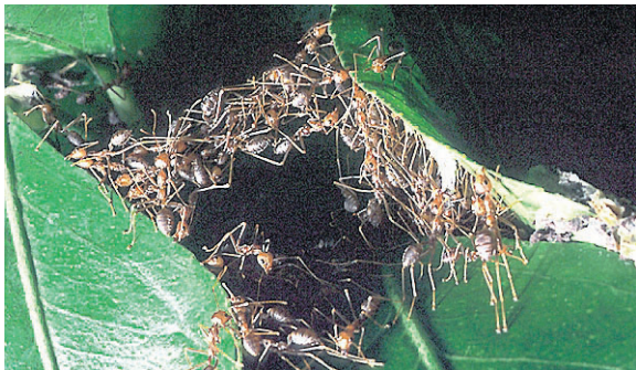
Myror kopplar ihop sig för att ta sig fram över ett gap.